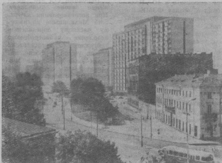
На снимке: центральная часть Варшавы.