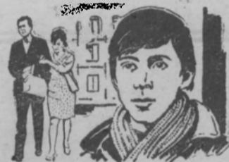
МАМА ВЫШЛА ЗАМУЖ

Успеху фильма, который радует правдивостью жизненных ситуаций и глубокой человечностью, способствует удивительно удачный выбор актеров на главные роли картины. Мать Бориса — Зину — играет актриса Московского театра имени В. Маяковского Л. Овчинникова. Она нам известна по многим кинокартинам: «Отчий дом», «Девичья весна», «9 дней одного года», «Хоккеисты», «Верность», «Звонят, откройте дверь». Как правило, роли у Л. Овчинниковой небольшие, но созданные ею образы надолго остаются в памяти зрителей. В роли Виктора снялся главный режиссер театра «Современник» Олег Ефремов. Он также часто снимается в кино. Мы видели