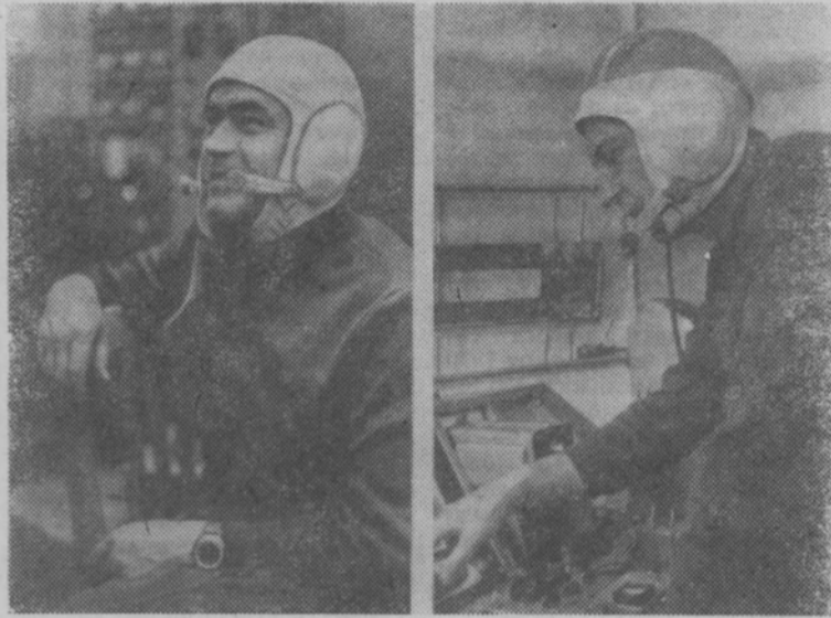
Командир космического корабля «Союз-9» А. Г. Николаев (слева) и бортинженер космического корабля В. И. Севастьянов.