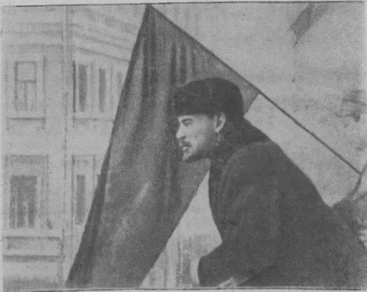
В. И. Ленин выступает с балкона Моссовета с приветствием бойцов коммунистам, отправляющимся на борьбу с Деникиным. Москва, 16 октября 1919 года.