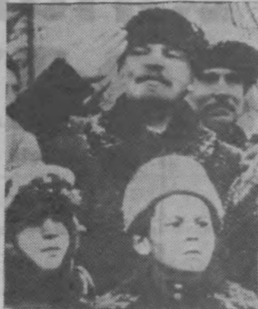
В. И. Ленин на Красной площади во время празднования 2-й годовщины Великой Октябрьской социалистической революции. Москва, 7 ноября 1919 года.