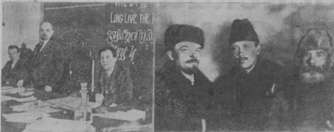
В. И. Ленин в президентуре I конгресса Коминтерна в Кремле. Слева направо: Г. Эберлейн,