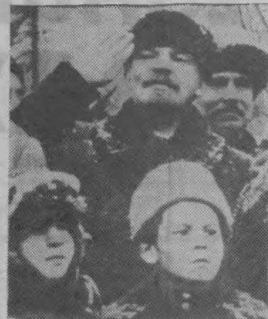
В. И. Ленин на Красной площади во время празднования 2-й годовщины Великой Октябрьской социалистической революции. Москва, 7 ноября 1919 года.