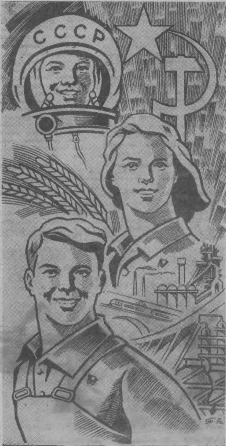
Рисунок художника С. Гринько