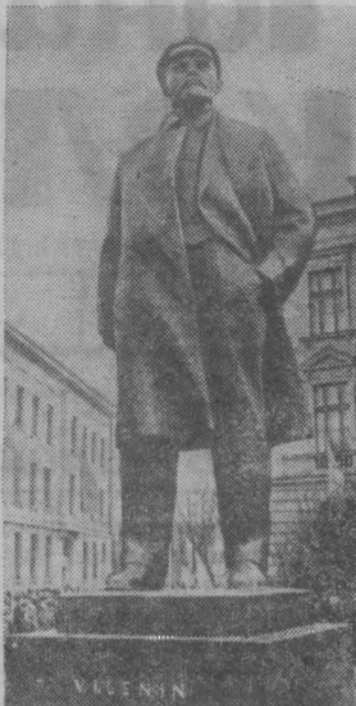
Чехословакия. Памятник Владимиру Ильичу Ленину, открытый на центральной площади в городе Градец-Кралове.