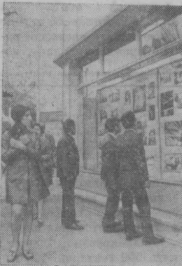
Иран. У здания Общества ирано-советской дружбы в Тегеране. Жители столицы знакомятся с фотовыставкой, рассказывающей о жизни и достижениях Советского Союза.