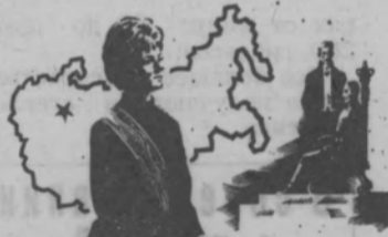
ПОСОЛ СОВЕТСКОГО СОЮЗА

Издание «Библиотечки» будет осуществлено в 1970—1971 гг. Первые пять книг выйдут в 1970 году. Ориентировочная цена всех книг «Библиотечки журналиста» — 4 рубля. Подписка принимается книжными магазинами, распространяющими подлинные издания.