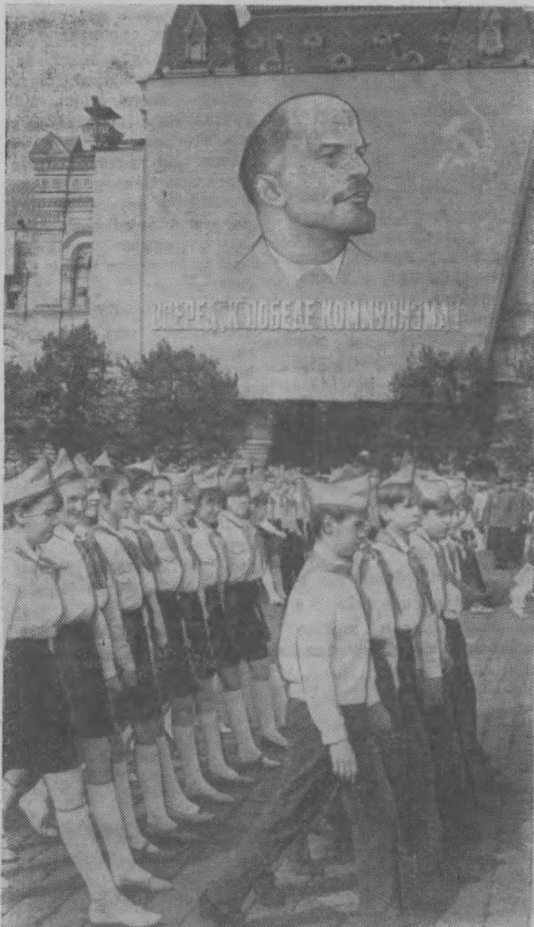
На снимке: парад юных ленинцев на Красной площади в Москве.