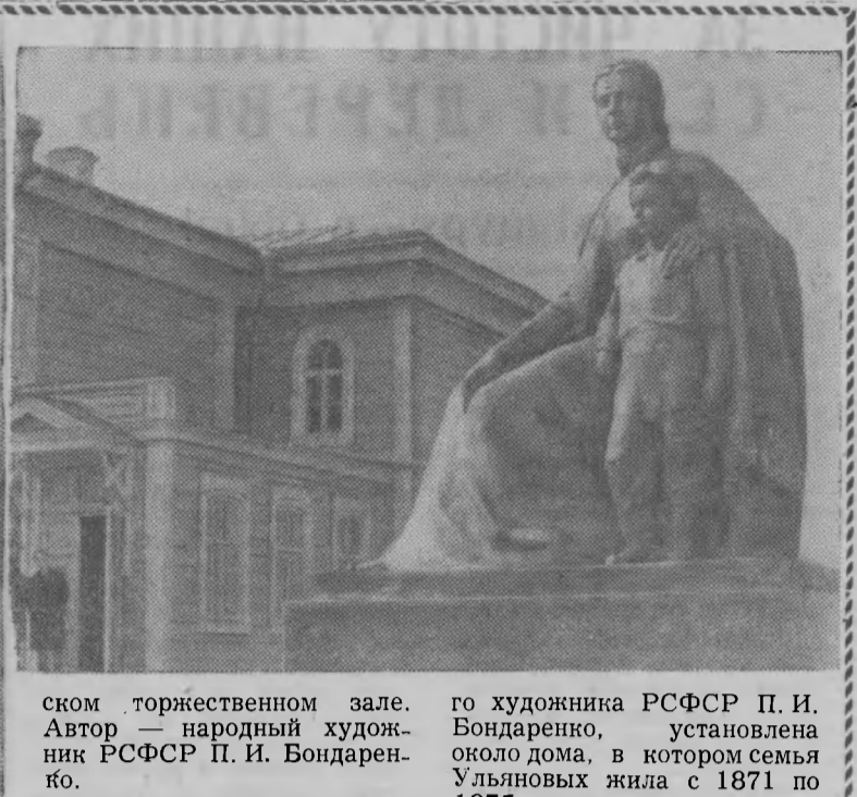
Автор — народный художник РСФСР П. И. Бондаренко.