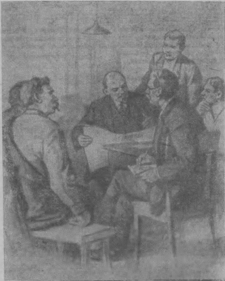
В. И. Ленин с рабочими корреспондентами в редакции газеты «Правда».