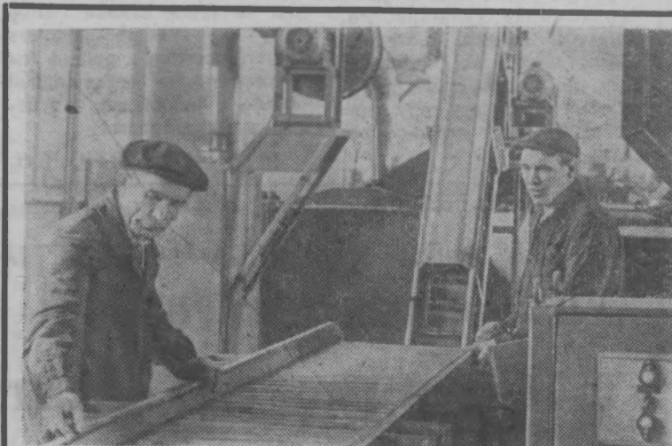
Свердловский завод торгового машиностроения освоил производство линий для сортировки и расфасовки фруктов. Изготовлена также опытная линия расфасовки картофеля в сетки по два-три килограмма.

В целях материального поощрения рабочих и кол-