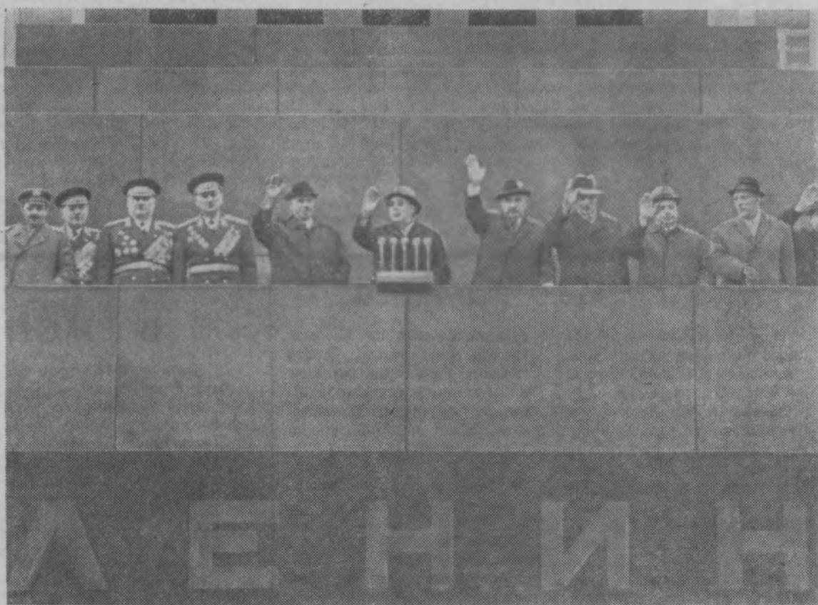
ДЕМОНСТРАЦИЯ ПРЕДСТАВИТЕЛЕЙ ТРУДЯЩИХСЯ НА КРАСНОЙ ПЛОЩАДИ. НА СНИМКЕ: НА ТРИБУНЕ МАВЗОЛЕЯ В. И. ЛЕНИНА.