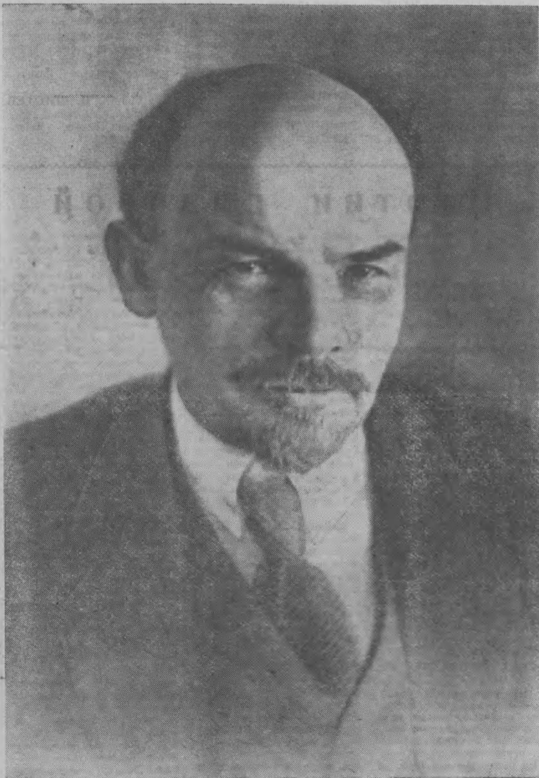
В. И. ЛЕНИН. ПЕТРОГРАД. ЯНВАРЬ 1918 ГОДА.