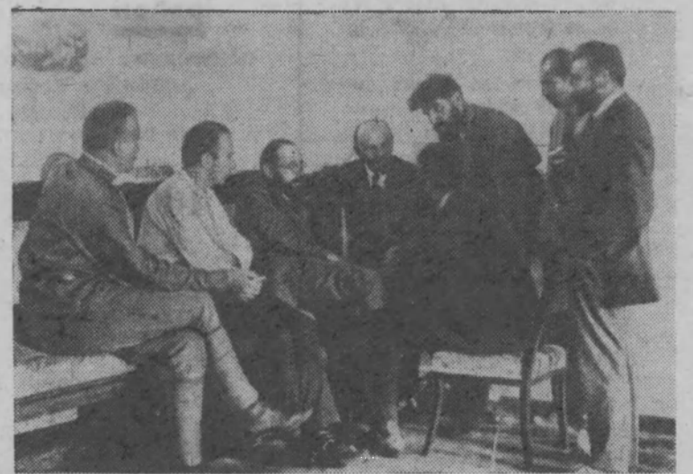
В. И. Ленин в Кремле беседует с итальянскими делегатами II конгресса Коминтерна. Москва, июль-август 1920 года.