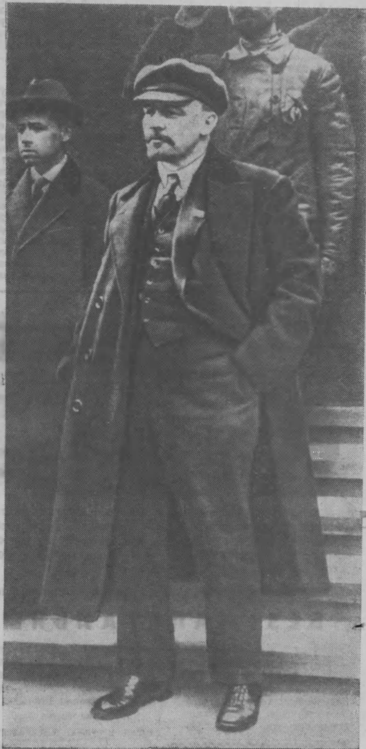
В. И. Ленин на Красной площади во время демонстрации 1 мая 1919 года.