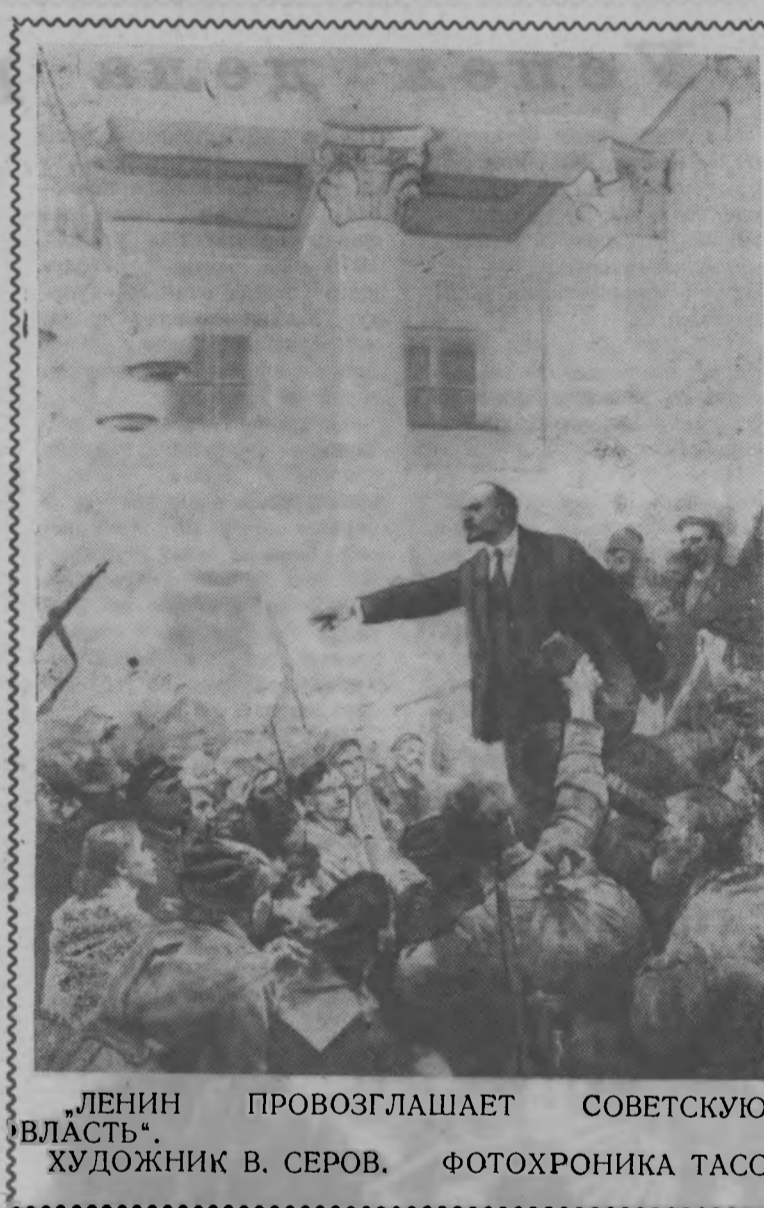
«ЛЕНИН ПРОВОЗГЛАШАЕТ СОВЕТСКУЮ ВЛАСТЬ». ХУДОЖНИК В. СЕРОВ. ФОТОХРОНИКА ТАСС