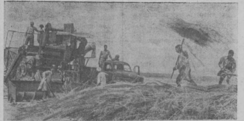
Индия. Обмолот зерна на ферме Сурагарх (штат Раджастан). Это механизированное хозяйство создано с помощью Советского Союза и является одним из самых крупных в юго-восточной Азии.

Вся аппаратура весит 16 килограммов и крепится на плечах и поясе рабочего. Ее использование полностью механизмирует рабочий процесс. При этом затраты труда сокращаются в три раза, а себестоимость работ — на 30 процентов. Ознакомиться с устройством можно на ВДНХ СССР в павильоне «Отделочные работы».