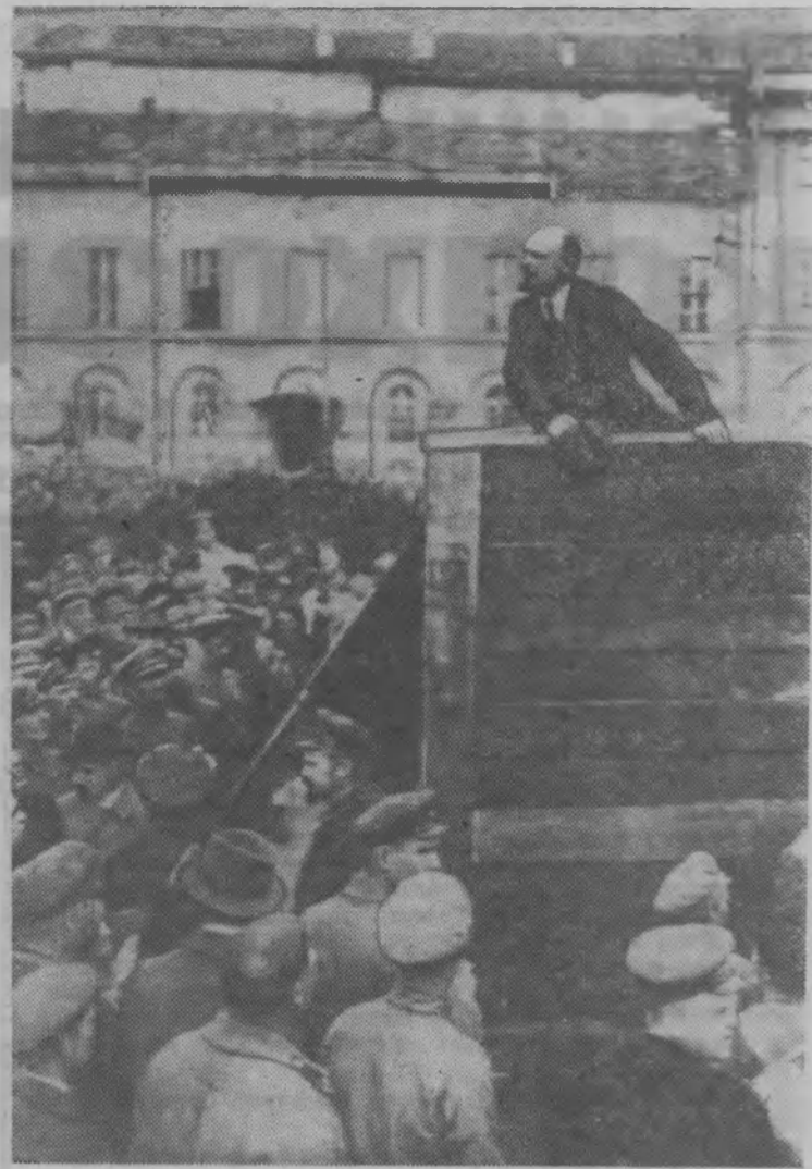
В. И. Ленин выступает с речью на площади Свердлова на параде войск, отправляющихся на польский фронт. 1920 год. 5 мая. Москва.