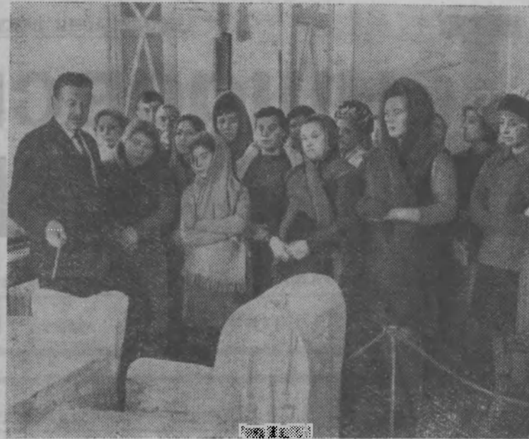
Московская область. Горки Ленинские — место, где жил, работал, отдыхал Владимир Ильич Ленин. С Горкам связан большой период жизни Ильича с осени 1918 по 1924 год.

Здесь он обдумывал многие важнейшие государственные и партийные дела. Здесь готовился к съездам партии, съездам Советов, к конгрессам Коминтерна.