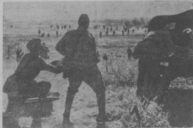
Великая Отечественная война. Бой в излучине Дона.