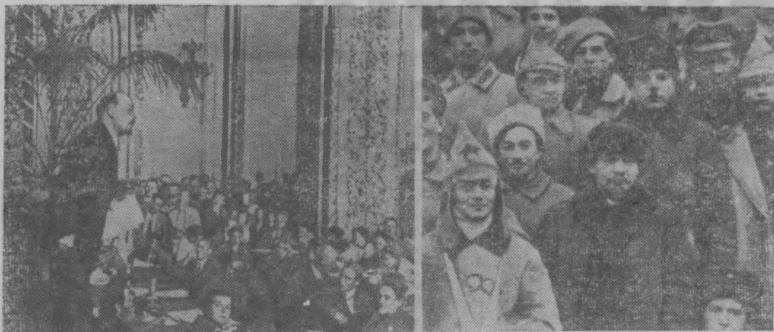
На снимках: сверху слева — В.И. Ленин произносит речь на заседании III конгресса Коминтерна в Андреевском зале