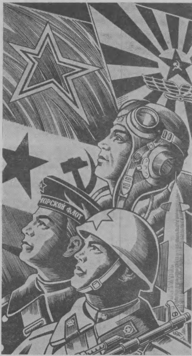
Рис. художника С. Гринько.

Одержав победу, они вернулись в родные места, сняли опаленные войной шинели и приступили к мирному труду, показывая образцы добросовестного отношения к своим обязанностям. Эти ветераны войны часто выступают с беседами и док-