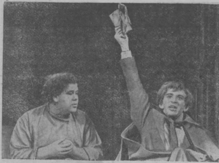
В Московском драматическом театре имени Гоголя состоялась премьера спектакля «Портрет» (сценическая композиция Г. С. Соколова, созданная по одноименной повести Н. В. Гоголя). Постановка — Г. С. Соколова. Художник — П. А. Белов.

Эстрадные песни прозвучали в исполнении А. Кокоулина. Веселое оживление в зале