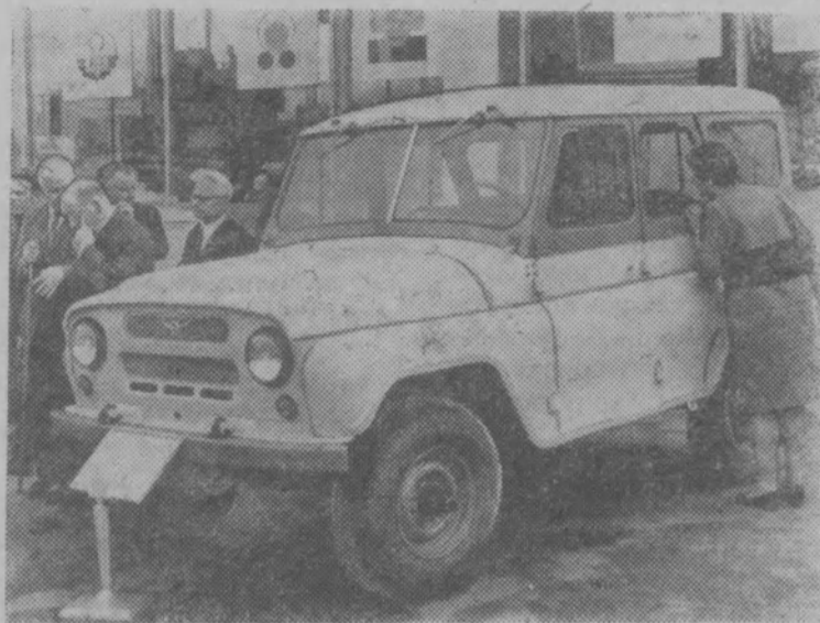
Автомобиль УАЗ-469 «Универсал»

Новинки автотехники показываются на ВДНХ СССР.