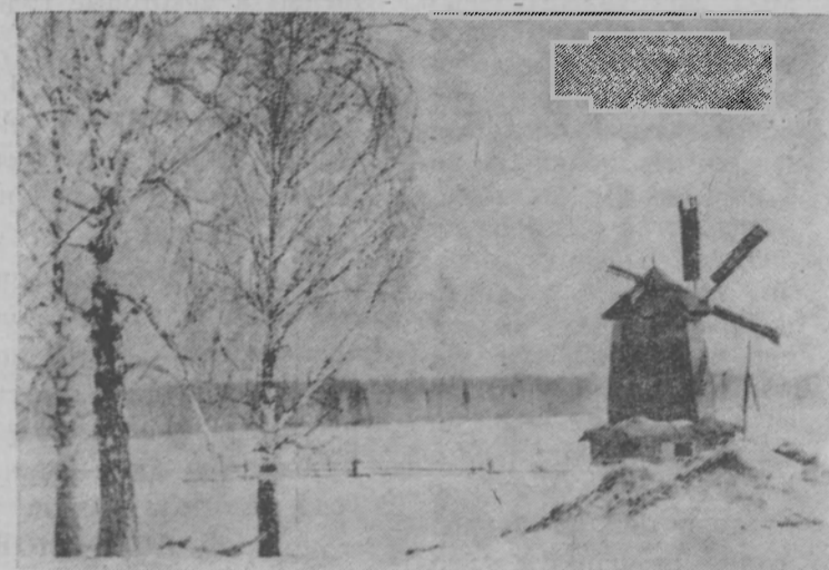
У старой мельницы.

БЫЛ ОН высокий, худощавый, прямой и строгий на вид мужчина. Левый рукав его, выдавшей виды гимнастерки, был всегда зашнурован за истертый солдатский ремень. Уцелевшая правая рука, если заворотить рукав, была обильно исчерчена шрамами и рубцами. Наши односельчане говорили о Евграфове по-разному. Кое-кто считал его чудачком, а женщины в большинстве жалели и называли несчастным. Мы, ребята, любили и льнули к нему, и он отвечал нам добром и лаской. Мне же пришлось с ним сойтись особенно близко и все благодаря рыбалке, до которой он был страстный охотник.