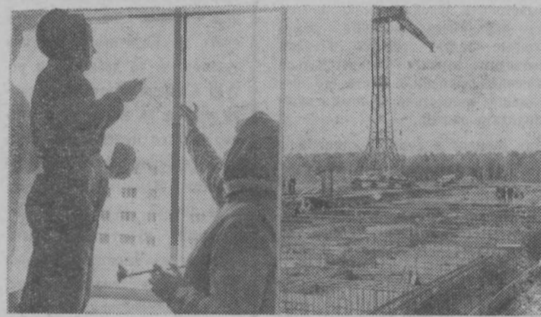
РЕШЕНИЯ ИЮЛЬСКОГО ПЛЕНУМА ЦК КПСС—В ЖИЗНИ!

Строительство. Как показывают цифры, план подрядных работ строительные организации в целом по району за 9 месяцев выполнили лишь на 82 процента. Меньше всех произведено работ ремонтно-строительным участком — на 229,7 тысячи рублей против 324 тысяч по плану. Надо отметить, что после нескольких месяцев провала плана, наконец, на 100 процентов выполнила свою программу межколхозная строительная организация. Она выполнила также и план сентября на 114 процентов. Всего на 1 процент меньше плана сделал в сентябре работ ремонтно-строительный участок. Другие организации план в сентябре провалили. И в общем по району он выполнен на 88 процентов.