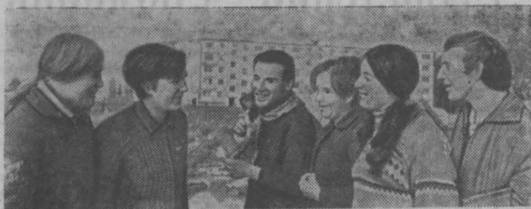
В пятидесяти километрах от Москвы строится свино-откормочный комбинат «Кузнецовский». Здесь будут вы-

Успех отчетно-выборного собрания будет зависеть прежде всего от хорошей подготовки к нему. Особое внимание нужно обратить на содержание доклада, на критический разбор работы профсоюзного комитета. Необходимо строго следить и за соблюдением на собраниях норм профсоюзной демократии.