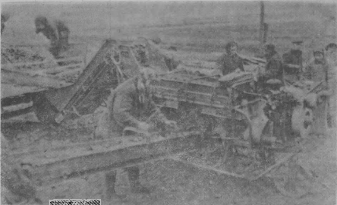
В сортировке поток клубней разделяется на три русла.