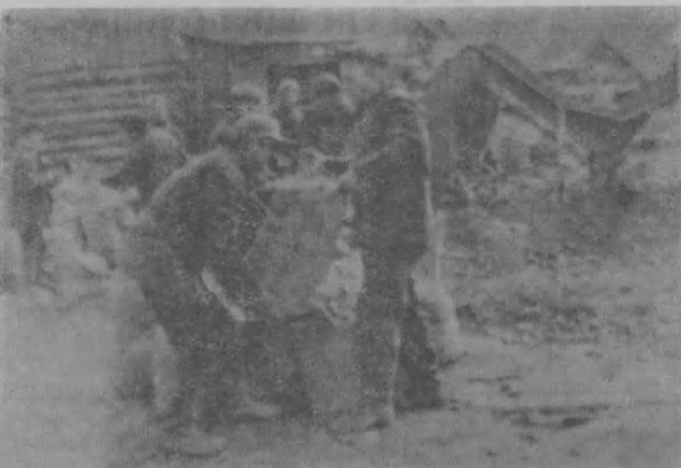
Грузчики. Они выполняют заключительную операцию в уборке картофеля.