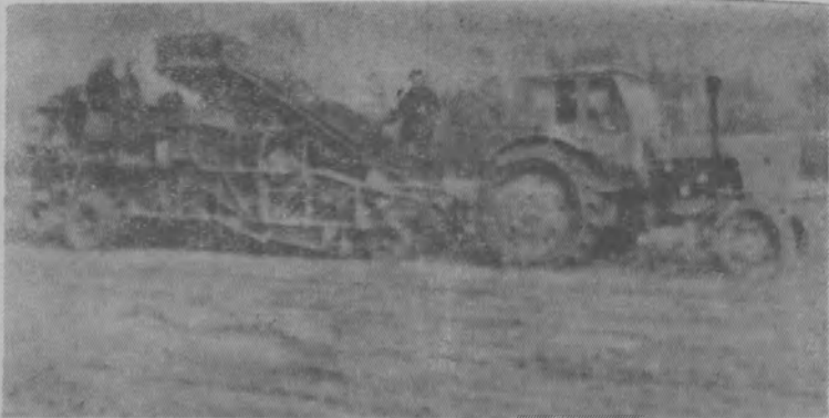
Картофелеуборочный агрегат вышел в поле.