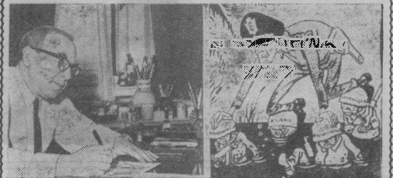
Москва. 28 сентября исполнилось 70 лет народному художнику СССР Борису Ефимову.

столяр мебельного цеха Пижемского леспромхоза.