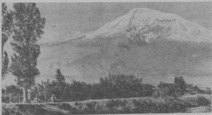
Армянская ССР. В Араратской долине.