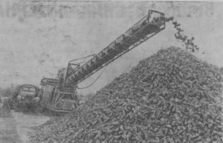
На Товарковский сахарный завод Тульской области начала поступать сахарная свекла нового урожая.