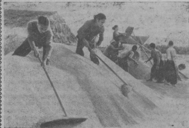
ДРВ. У рисоводов провинции Тхайбинь. Этот снимок сделан на току в кооперативе Ву Тханг. Крестьяне

Всего в совхозе выкопано 60 гектаров картофеля, что составляет половину плана. Ведем сдачу картофеля государству.