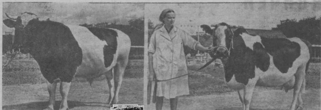
Москва. На Выставке достижений чародно-го хозяйства СССР проходит смотр крупного рогатого скота. Демонстрируются выдающиеся представители молочных пород из Белоруссии, Литвы, Латвии, Эстонии.

На снимке (слева): бык «Робот» чернопестрой породы из колхоза имени Мичурина Харьковского района Эстонской ССР. Вес 810 килограммов. Его мать имеет годовой удой в 6412 кг молока, жирность — 4,14 процента.