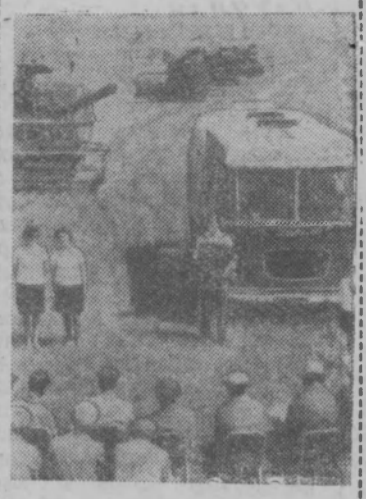
Воронежская область. В колхозе имени 40-й Богучарской дивизии.

Поселок встал — не сосчитать дворов. ...Пылит опять знакомая дорога, И в предвечерней множась пелене, Из-за верхушек дремлющего лога Густущий лес антенн плывет навстречу мне. Уж вечер ленту розовую ткет, Занат, разлившись по небу, алеет. И край лесной светлей из года в год, Поселок с каждым годом молодеет.