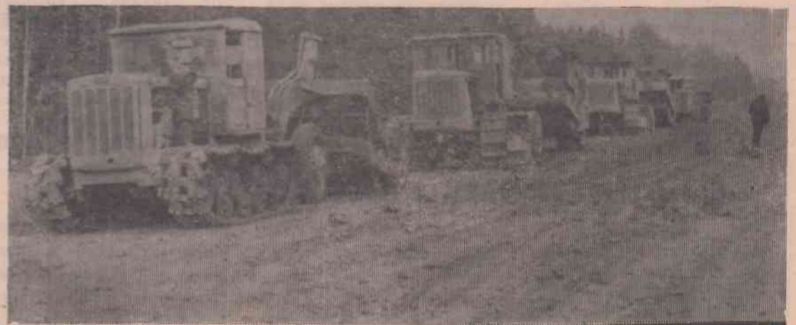
Там, где строится дорога на Ошминское.