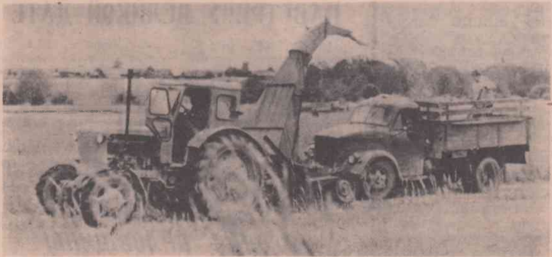
Уборка клеверной массы на силос в колхозе „Путь Ленина“.