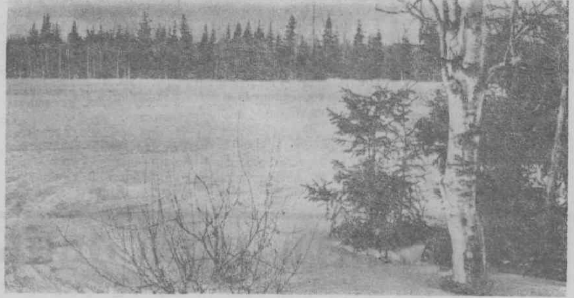
На лесной поляне.