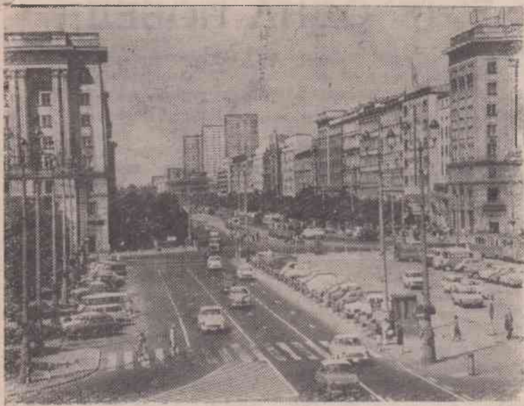
Варшава. Центральная магистраль возрожденной столицы — Маршалковская улица.