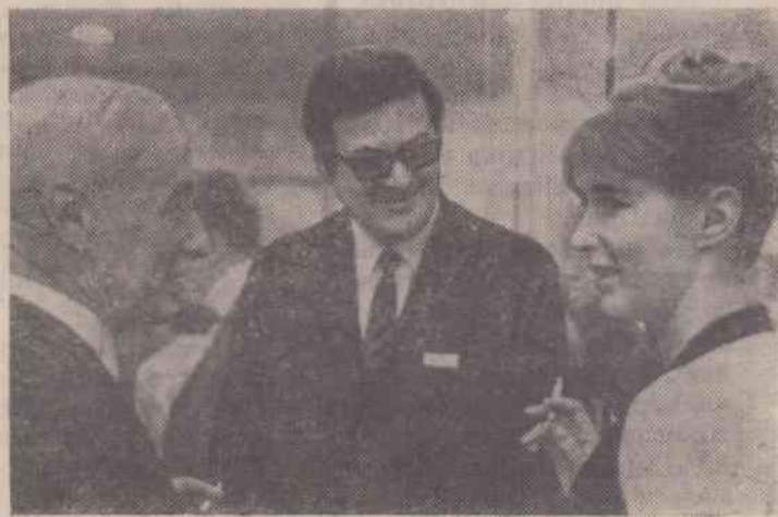
Москва. VI международный кинофестиваль.

Тоншаевская типография Горьковского облуправления по печати. Заказ 422 Тираж 3564