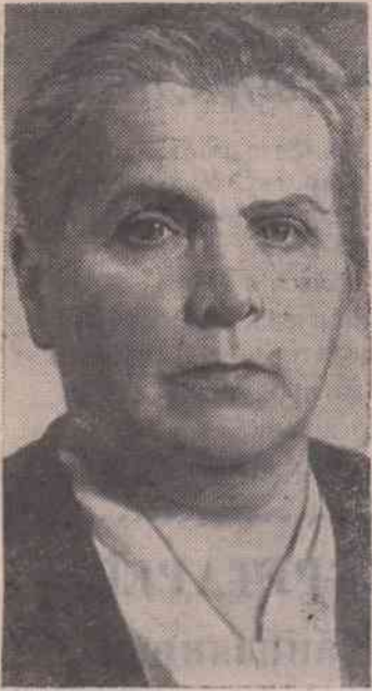
1 июля исполняется 80 лет со дня рождения Веры Игнатьевны Мухиной, (1889—1953) выдающегося советского скульптора.

Она является автором таких известных монументальных произведений, как «Рабочий и колхозница», памятников М. Горькому, П. И. Чайковскому, академику А. Н. Крылову и др.