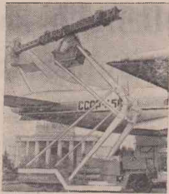
Москва. Эта самоходная механизированная установка «МММ-1» для на-