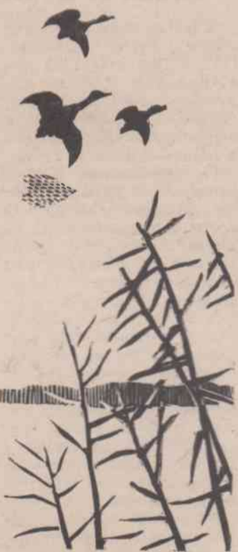
Над тихими речными заводьями.