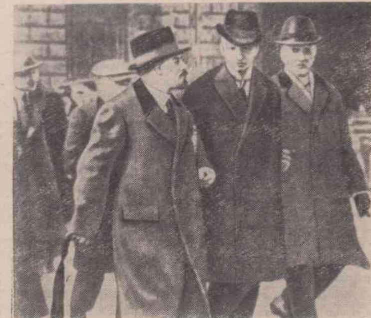
На снимке: В. И. Ленин в Стокгольме проездом при возвращении из Швейцарии в Россию. Апрель 1917 года.