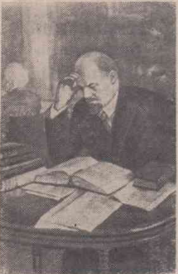
«В. И. Ленин в Бернской библиотеке за работой над книгой «Империализм, как высшая стадия капитализма» (рис. художника В. Перельмана).