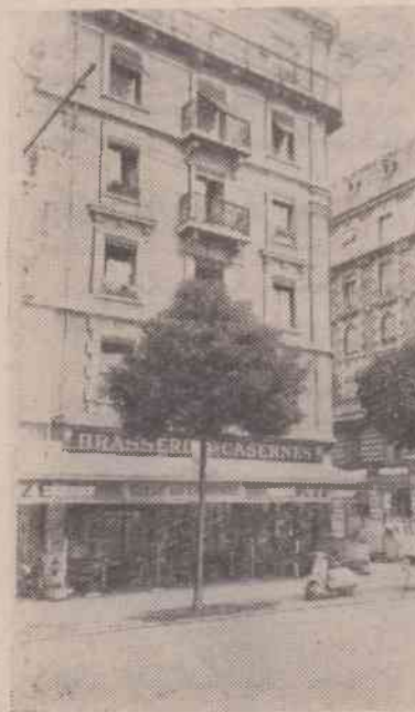
На снимке: Женева. Улица Дрюа-Мелли, 6. В начале XX века в кафе «Назерн» находился Народный дом, где собирались политэмигранты. Здесь неоднократно выступал В. И. Ленин.

Сразу же после победы Февральской революции Владимир Ильич стремился как можно скорее возвратиться на родину. Но проехать через воюющие страны было нелегко. Наконец, проезд удалось осуществить через Германию и Швецию. В начале апреля 1917 года Ленин приехал в Петроград.