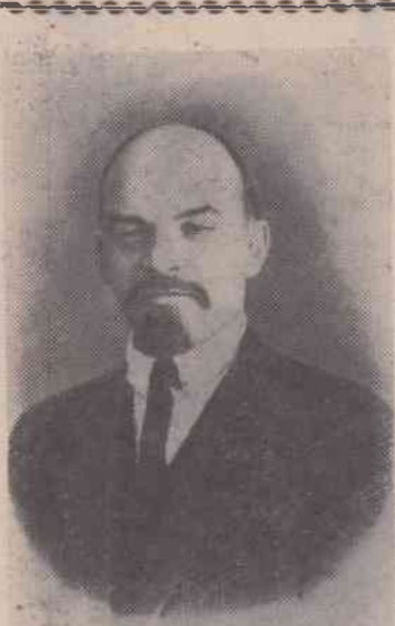
В. И. Ленин. Цюрих (Швейцария), 1917 год.