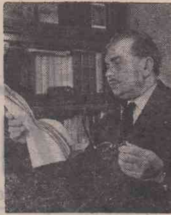
31 мая исполняется 70 лет со дня рождения выдающегося советского писателя лауреата Ленинской премии Леонида Максимовича Леонова.

Проза, драматургия, публицистика Леонова отмечены высоким гражданским пафосом, патриотизмом, политической направленностью. Его произведения с полным правом можно назвать своеобразной летописью жизни нашего общества. В самом крупном романе Леонова — «Русский лес» наиболее отчетливо проявились основные черты дарования писателя — широта социальных и философских обобщений, тонкость психологического анализа, исключительное богатство языка. Широко известны его романы — «Барсуки», «Соть», «Дорога на Океан»; пьесы — «Нашествие», «Золотая карета».