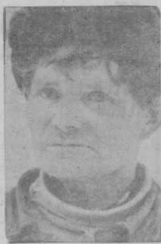
Фото и текст В. Каляпина.

Анализ итогов 1968 года по производству мяса крупного рогатого скота в соседних колхозах «Коммунар» и «Красная нива» показывает, что здесь в этом направлении работают по-разному.