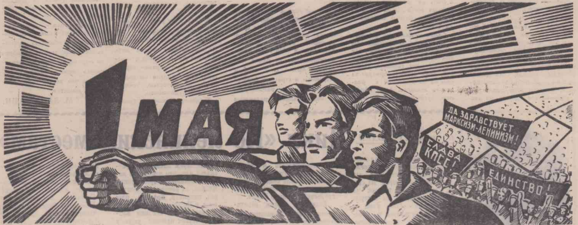
Плакат художника А. Фирсова.