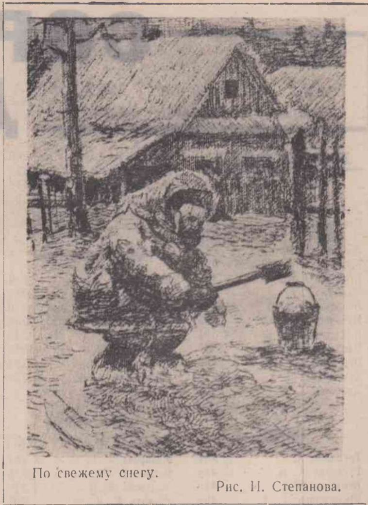
По свежему снегу.

старшая пионервожатая Шайгинской средней школы.