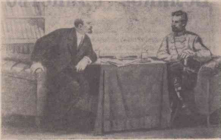
Москва. „В. И. Ленин и Вооруженные силы“ — это основная тема, над которой работают сейчас военные художники студии имени М. Б. Грекова.