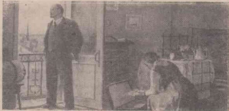
«Перед отъездом в Россию». Картина худ. И. Беляковой.

тицией к царю. По приказу царского правительства войска открыли по безоружным людям огонь. Было убито более 1000 человек и ранено около 5 тысяч. Это кровавое злодеяние всколыхнуло массы. Повсюду начались демонстрации, стачки. Рабочие взяли за оружие. На улицах были воздвигнуты баррикады.