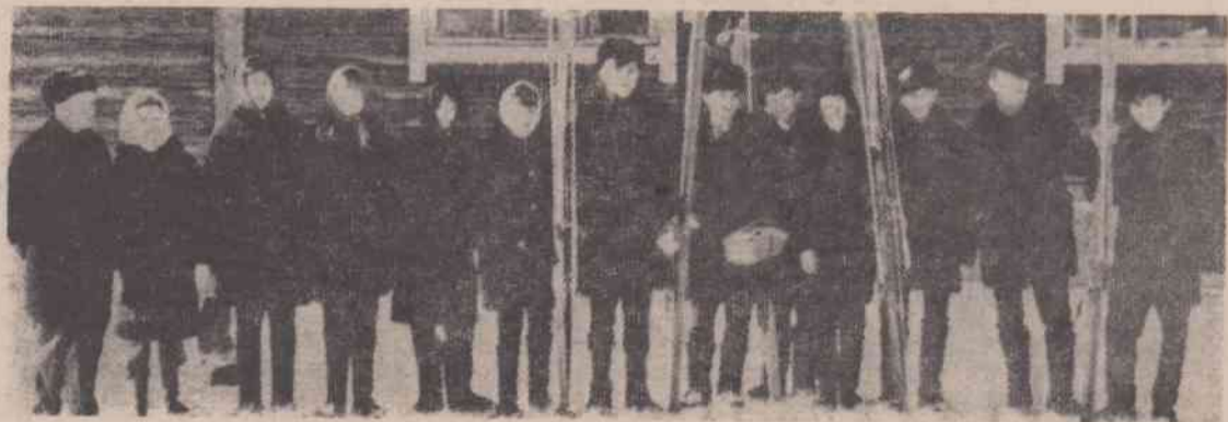
Команда спортсменов Лесозаводской восьмилетней школы.