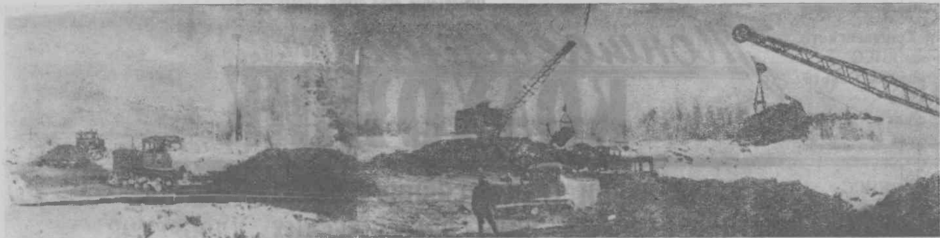
ИДЕТ ТРЕХМЕСЯЧНИК ПО ЗАГОТОВКЕ И ВЫВОЗКЕ ОРГАНИЧЕСКИХ УДОБРЕНИЙ