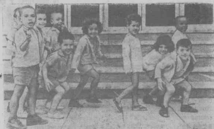
Республика Куба. Вниманием и заботой окружил кубинский народ молодое поколение. Для малышей созданы детские сады и ясли.

На социалистическое соревнование вызываем Шахунский «Межколхозстрой».