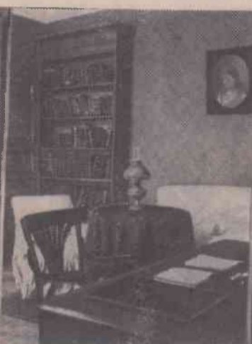
На снимках (слева направо): афиша спектакля «Три сестры», поставленного в Японии. Рабочий кабинет А. П. Чехова.