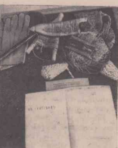
Личные вещи и рыболовные принадлежности писателя.