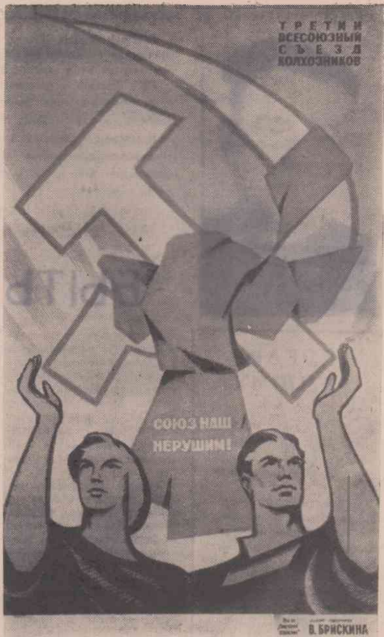
«Союз наш нерушим!» — плакат художника В. Брискина, выпущенный к Третьему Всесоюзному съезду колхозников.

Эти выводы, подчеркнул Д. С. Полянский, свидетельствуют о том, что колхозный строй, изменив коренным образом весь уклад жизни в деревне, открывает перед сельскими тружениками новые,