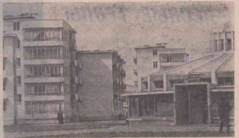
Хорошеет и благоустраивается Улан-Батор. В жилых кварталах города много магазинов, предприятий бытового обслуживания, школ и больниц.

Ч. НАМЖИЛОВ, корреспондент ТАСС. Улан-Батор.