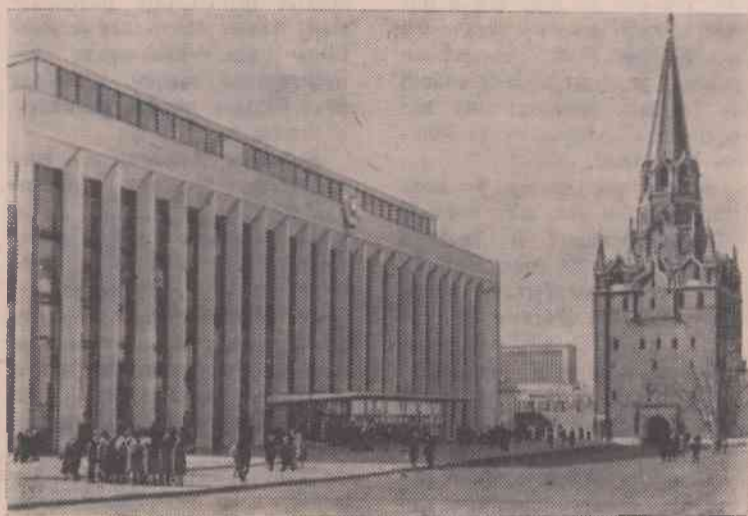
Москва. Кремлевский Дворец съездов. Здесь сегодня начинается работу Третий Всесоюзный съезд колхозников.

Мы призываем всех тружеников колхозов и совхозов района включиться в социалистическое соревнование за увеличение производства сельскохозяйственных продуктов в честь славного юбилея нашей страны — 100-летия со дня рождения В. И. Ленина.