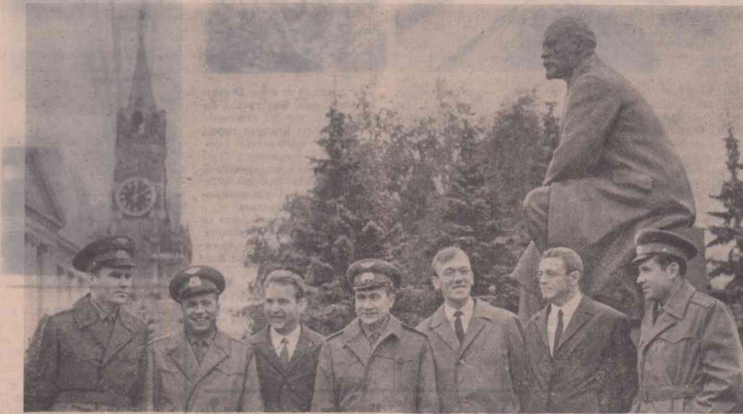
Участники нового эксперимента в космосе летчики-космонавты СССР (слева направо) В. А. Шаталов, В. В. Горбатко, В. Н. Кубасов, А. В. Филипченко, А. С. Елисеев, В. Н. Волков и Г. С. Шонин.