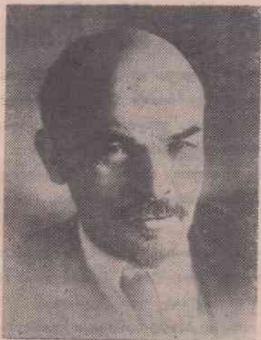
В. И. Ленин. Снимок сделан в Смольном в январе 1918 г.

Весть о свержении царизма застала Ленина в эмиграции. При первой же возможности, он покидает Швейцарию и возвращается в Россию. 3 (16) апреля поздно вечером поезд, в котором Владимир Ильич прибыл в Петроград, подошел к перрону Финляндского вокзала, где тысячи людей — рабочих, солдат, матросов собрались встретить своего вождя.