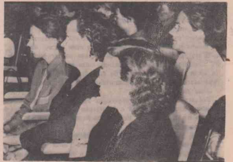
В ЗАЛЕ ЗАСЕДАНИЙ.

От теоретической подготовки, образовательного уровня, эрудиции учителя во многом зависит постановка преподавания учебного предмета и качество знаний учащихся. В конечном итоге успешнее решается основная проблема школы — преодоление второгодничества и выполнение восьмилетнего всеобщего образования. Лучшие мастера педагогического труда настойчиво совершенствуют методы преподавания, добиваются высокой эффективности каждого урока, требуют к себе и учащимся, держат в поле зрения каждого уча-