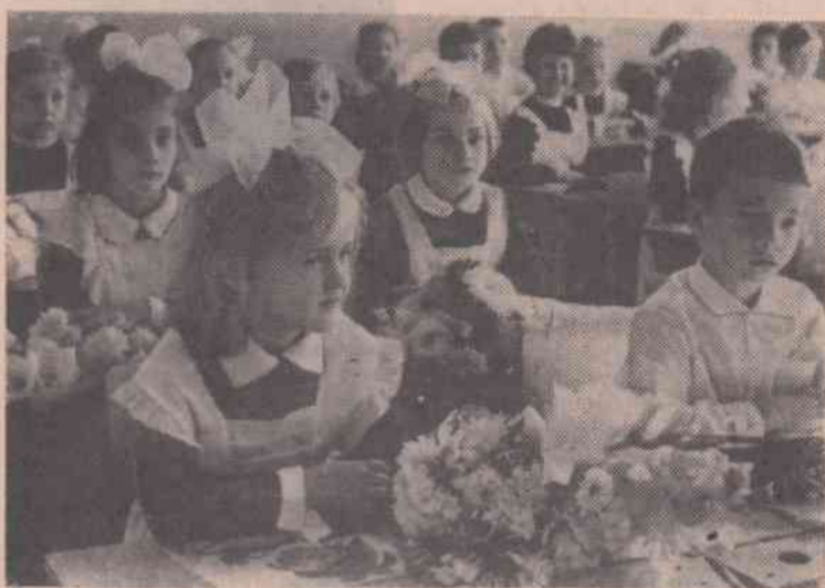
Как большой и радостный праздник отмечает всегда советский народ этот день. Почти каждый третий гражданин Страны Советов 1 сентября начинает свой новый учебный год.