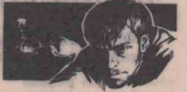
ЭКСПЕРИМЕНТ ДОКТОРА АБСТА

заболевшего доктора Марту, а заодно займется лечением и самой Марты. Как только она сможет работать, его ликвидируют.