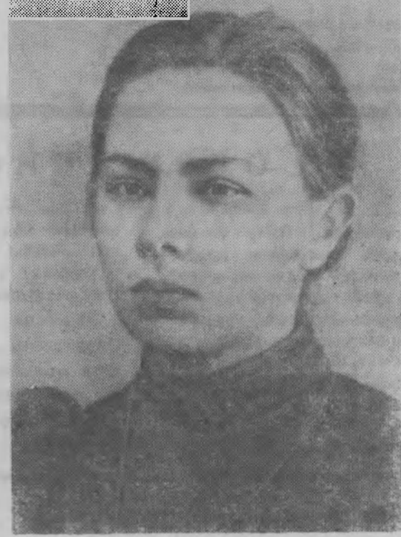
Н. К. Крупская. (Фото 1895 года)

книгу «Развитие капитализма в России», завершившую идейный разгром народничества. Она вышла из печати в марте 1899 года под псевдонимом Владимир Ильин.