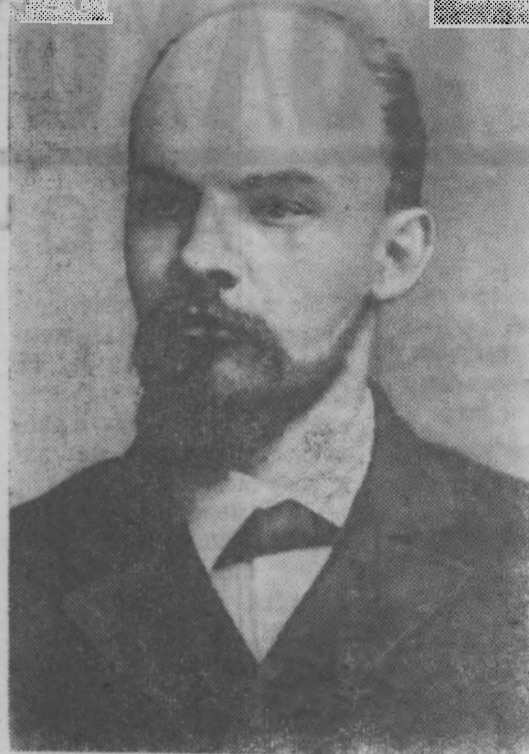
В. И. Ленин. (Фото 1897 года)