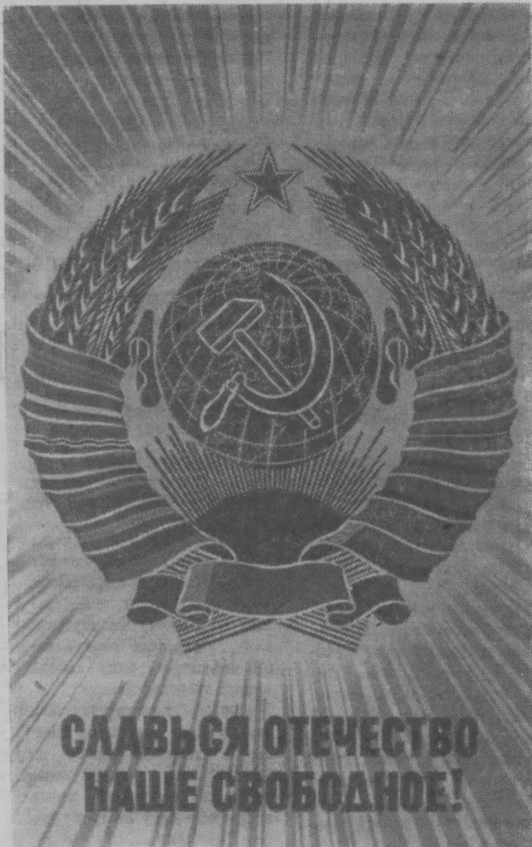
Плакат художника В. Викторова.