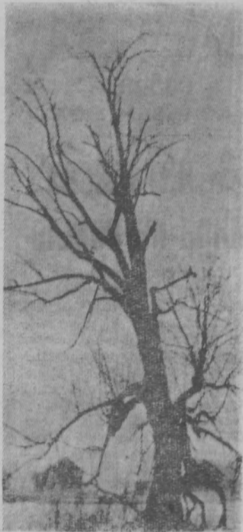
Зимняя графика.